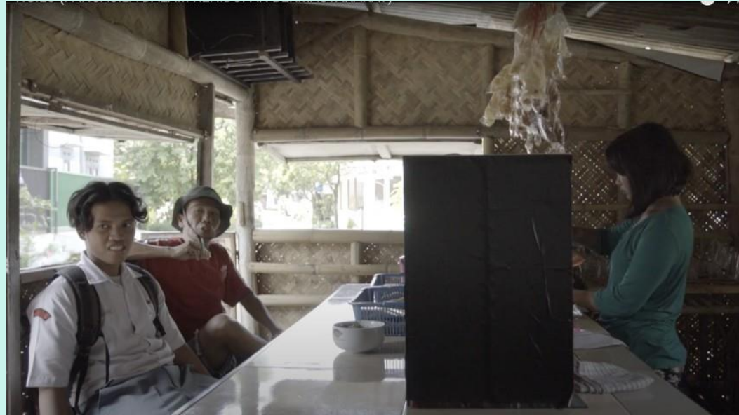
TONALITAS : KONTRAS DAN EXPOSURE

PROSES MEREKAM GAMBAR YANG MEMBUKA KEMUNGINAN PILIHAN DAN KONTROL PEMBUAT FILM