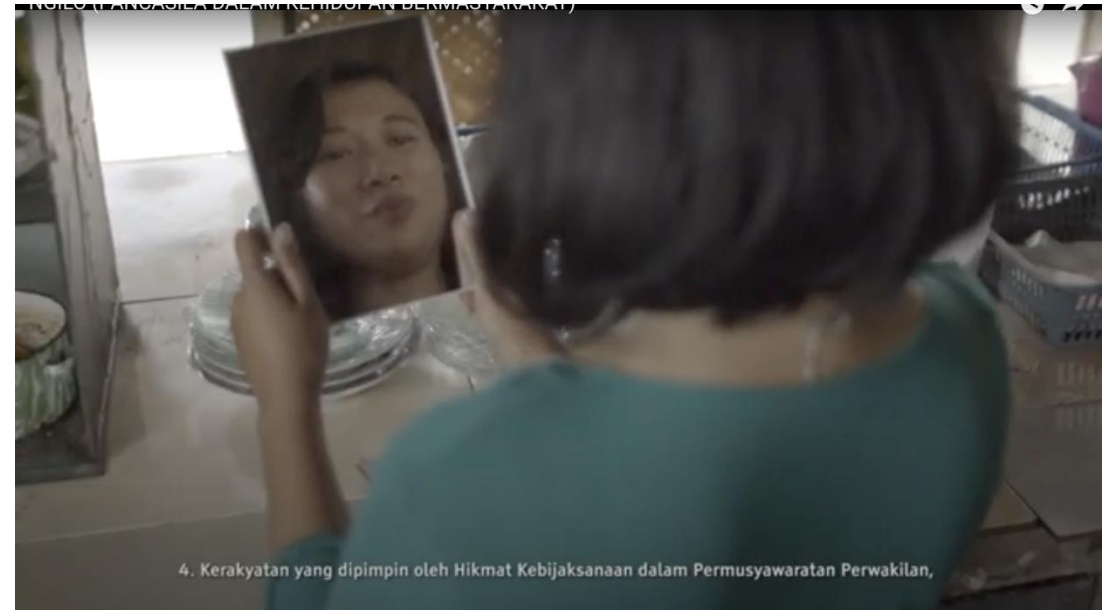
4. Kerakyatan yang dipimpin oleh Hikmat Kebijaksanaan dalam Permusyawaratan Perwakilan,